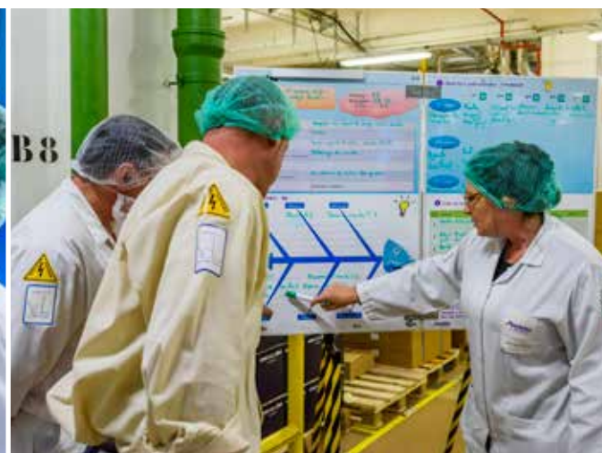
> Légende avec retrait